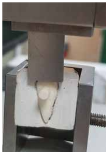
Рисунок 1. Определение адгезионной прочности при сдвиге

В процессе подготовки к эксперименту зубы случайным образом разделили на 6 равных групп. В группах срезы зубов предварительно обрабатывали в соответствии с протоколом эндодонтического лечения зубов с диагнозом K04.5 Периодонтит: поверхность дентина обрабатывалась 3% гипохлоритом натрия, промывалась водой, затем 17% раствором ЭДТА с обильным промыванием водой и высушиванием. На поверхность дентина образцов зубов 1 группы (контроль) закрепляли форму, заполняемую материалом «Эпоксидин Дуо». Материал отверждался в термостате. Во 2 группе перед внесением герметика срез дентина образцов зубов дополнительно обрабатывали «Жидкостью для высушивания и обезжиривания твердых тканей зуба». В 3 группе на срез дентина образцов зубов наносили пасту с гидроокисью кальция на гидрофильной основе «Кальцетин эндо». После экспозиции в течение 48 часов пасту удаляли механически и поверхность зуба повторно обрабатывали 3% гипохлоритом натрия, смывали водой, затем обрабатывали 17% раствором ЭДТА с обильным промыванием водой и высушиванием. В 4 группе на срез дентина образцов зубов наносили пасту с гидроокисью кальция на гидрофильной основе «Кальцетин эндо». После экспозиции в течение 48 часов пасту удаляли механически и поверхность зуба повторно обрабатывали 3% гипохлоритом натрия, смывали водой, затем обрабатывали